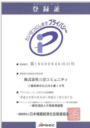
プライバシーマーク登録証

(株)三交コミュニティは、三重県の管理会社として初めて取得した「プライバシーマーク」の登録を、2017年5月に更新しました。今後ともより一層お客様に信頼いただける会社を目指して事業活動に努めています。