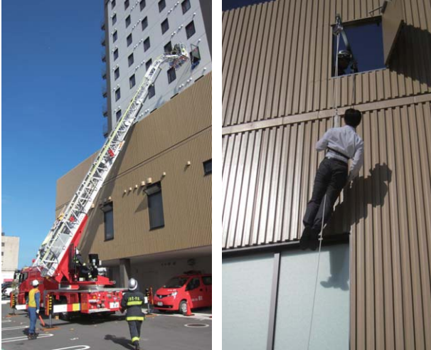
三交イン伊勢市駅前での消防訓練の様子

2017年11月には三交イン伊勢市駅前にて、伊勢市消防本部からはしご車も加わった大規模な消防訓練も実施されました。