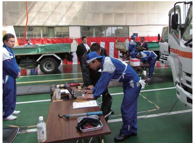
自動車サービス部品技能コンテストの様子

三重いすゞ自動車(株)は、毎年社内サービス・部品技能コンテストを開催し、日頃の業務で身につけた知識・技術を競い合います。このような取組みで、社員一人一人が技術を向上させることにより、サービスに対する安全性を高めています。入賞した社員の中から、いすゞ自動車主催の中部支部コンテスト及び全国のコンテストへ出場します。