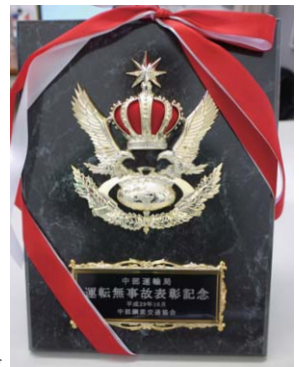
運転無事故表彰記念

御在所ロープウェイ(株)は2018年10月、2002年～2017年の15年間の索道の責任事故が皆無という功績が評価され、中部運輸局長より表彰されました。