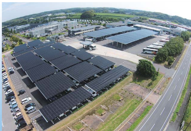
バス駐車場に設置した太陽光パネル付き上屋(津市:中勢営業所)