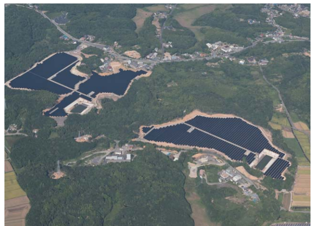
志摩市阿児立神メガソーラー発電所