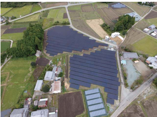
多気メガソーラー第4発電所