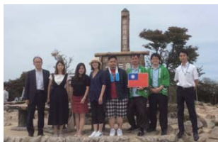
御在所ロープウェイ視察 (台湾旅行業界最大手「ライオングループ」)

三重交通グループホールディングス(株)は訪日外国人観光客の三重県への誘致活動を推進しており、2017年9月、三重県と連携して、台湾旅行業界最大手である「ライオングループ」(雄獅集団)を招請し、県内の観光地および当社グループ施設等を視察する下見招待旅行を実施し、伊勢神宮や伊賀流忍者博物館、御在所ロープウェイなどを視察していただきました。