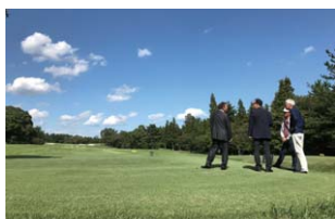
松阪カントリークラブ視察 (台湾ゴルフ専門大手旅行会社「Cash Golf」)

また、同月、県内のゴルフ場を観光資源に活用すべく台湾のゴルフ専門大手旅行会社「Cash Golf」を招請し、当社グループの松阪カントリークラブや県内のゴルフ場、その他観光施設等を視察する下見招待旅行を実施しました。