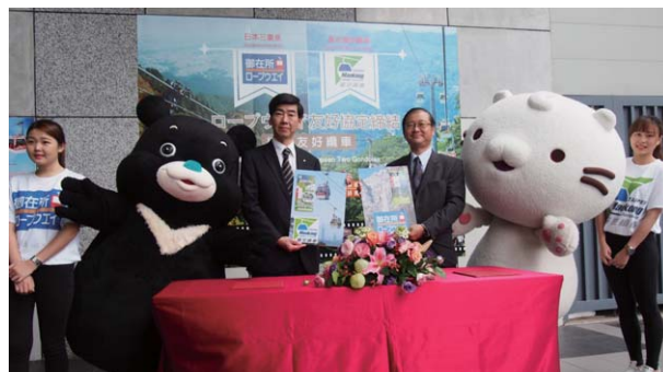
猫空ロープウェイとの調印式の様子

相互誘客の取組みとして、お互いのポスターやパンフレットを設置し、そのパンフレットを持参すれば割引サービスを受ける事ができます。今後は、三重県と台北市との観光交流の架け橋となるように、相互PRなどを通して友好関係を深めてまいります。