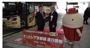
セントレア京都線出発式

名阪近鉄バス(株)は、2018年2月に中部国際空港「セントレア」から京都駅八条口を結ぶ、「セントレア京都線」の運行を開始し、国際的に人気のある京都と中部の観光地を結ぶ周遊ルートを設定しました。 ※Wi-Fi、USBポート有