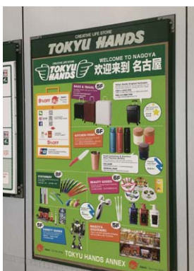
(株)三交クリエイティブ・ライフ

バス停リニューアル(2016年春) (日本語・英語・ひらがな表記+ピクトグラム(案内用図記号))