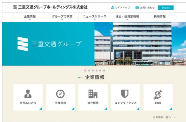
三重交通グループホールディングス(株)ホームページ/日本語サイト

また、グループの最新ニュースをホームページ内で紹介したり、英語サイトもあり、外国人投資家の方々へも分かりやすく情報を公開しています。