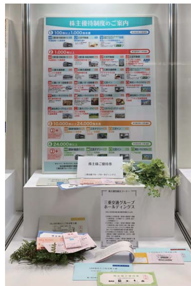
名証IR 株主優待コーナー