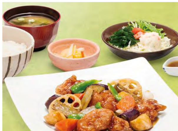
一番人気 !! 「鶏と野菜の黒酢あん定食」