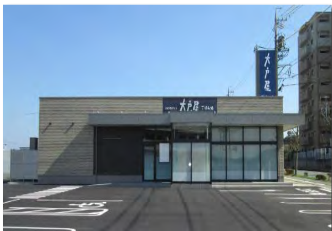
大戸屋ごはん処「津山の手店」

スタッフ一同、末永くみなさまに愛される店舗づくりに努めてまいりますので、ご愛顧お引き立てのほどよろしくお願い申し上げます。なお、詳細は下記のとおりです。