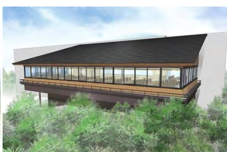
山頂リニューアル 【展望レストラン 外観イメージ】