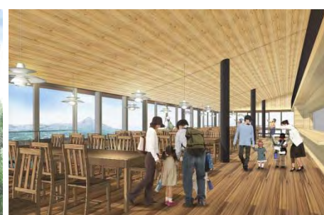
山頂リニューアル 【展望レストラン 内観イメージ】

【参考】新レストラン完成後、既存レストランアゼリア(旧山上ホテル/約1,300㎡)を解体し、展望デッキに改修する予定です