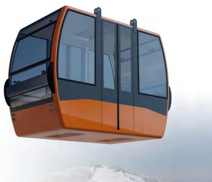
【新型ゴンドラ 外観イメージ】