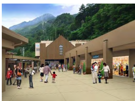
山麓リニューアル 【外観イメージ】