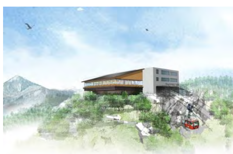
山頂リニューアル 【展望レストラン 外観イメージ】