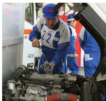
自動車サービス・部品技能コンテストの様子

三重いすゞ自動車(株)は、毎年社内サービス・部品技能コンテストを開催し、日頃の業務で身につけた知識・技術を競い合います。社員一人ひとりが技術を向上させることにより、サービスに対する安全性を高めています。入賞した社員の中から、いすゞ自動車主催の中部支部、及び、全国のコンテストへ出場します。