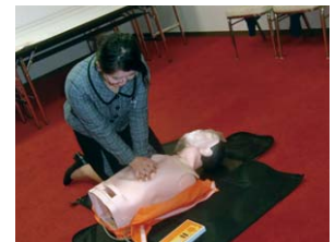
一般救命講習の様子

鳥羽シーサイドホテル(株)は、2019年3月12日に鳥羽消防署から講師を招き、救命講習を受講しました。19名がAEDの使用方法などを実際に器具や人形を用いて訓練しました。緊急時に備え、どの部門のスタッフでも初動活動に携われるよう今後も定期的に開催する予定です。