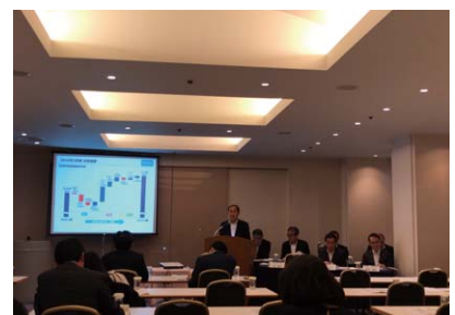
決算説明会の様子

三重交通グループホールディングス(株)は、2014年度決算より毎年2回、東京にて機関投資家・アナリスト向けに決算説明会を行っています。当社経営者が、決算概要や業績予想、中期経営計画の進捗を説明し質疑応答の時間を設け、投資家との建設的な対話を行っています。2018年度は、第2四半期決算について同年11月29日に、通期決算について2019年5月30日に行いました。また、機関投資家・アナリストとの個別ミーティングを積極的に行っています。