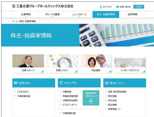
三重交通グループホールディングス(株)ホームページ/日本語サイト

また、グループの最新ニュースもホームページ内で紹介し、英語版のサイトでは、外国人投資家の方々へも分かりやすく情報を公開しています。