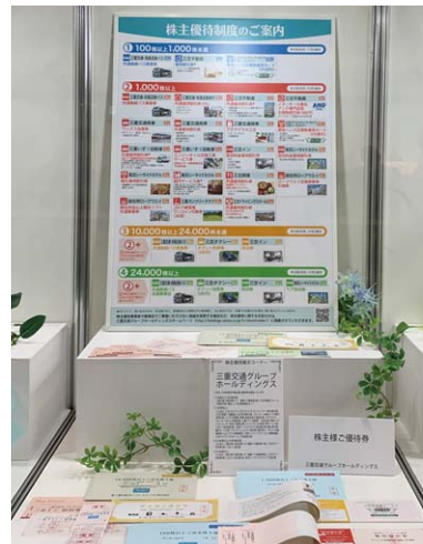
名証IR エキスポ 株主優待コーナー