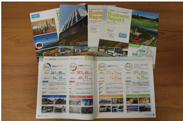
ビジネスレポート

三重交通グループホールディングス(株)は、事業報告等をまとめた冊子「ビジネスレポート」を年2回発行し、株主様にお送りしたり、ホームページにて公開しています。